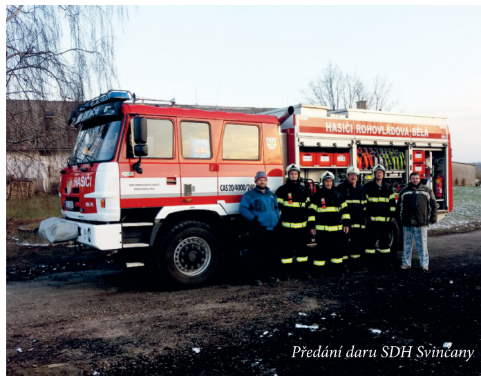
Předání daru SDH Svinčany

V prvních dnech roku 2019, konkrétně 7. ledna, vyjela jednotka na požár tlakové lahve a kuchyně rodinného domu v Lázních Bohdaneči. Prvotní zásah provedli strážníci Městské policie Lázní Bohdaneč hasičími přístroji a i díky jejich včasné reakci nedošlo k rozšíření požáru. Jednotka byla i z tohoto důvodu odvolána po cestě k zásahu těsně před Bohdančí a tudíž nezasahovala. V sobotu 19. ledna proběhla v hasičské zbrojnici výroční schůze, na které byla prezentována činnost celého sboru včetně jeho soutěžních družstev mužů a žen a výjezdové jednotky. Výroční schůze s tradiční večeří je odměnou pro všechny členy za jejich činnost za celý rok. Děkujeme všem členům a hostům za účast a slova podpory při našem konání. Soutěžním týmům přejeme mnoho úspěchů v nadcházející sezoně. V rámci výroční schůze proběhla sbírka na pomoc dobrovolným hasičům ze Svinčan, kterým žhář před koncem roku vypálil jejich klubovnu. Během sbírky byly vybrány téměř dva tisíce korun, které naše SDH doplnilo do celkové částky 5.000 Kč. Tu jsme druhý den po naší výroční schůzi předali zástupcům SDH Svinčany pro obnovu jejich vybavení. Všem dárcům od nich vzkazujeme veliké DÍKY!!!