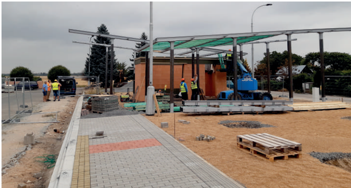
„Výstavba BUS terminálu.“

V současné době probíhá realizace dvou celkem velkých stavebních projektů. Prvním je přestavba autobusového nádraží u hřbitova, oficiálně „Přestupního terminálu autobusové dopravy“. Po dlouhých přípravách, kdy probíhaly zemní práce, budování základů a přípojek elektřiky a vody, začíná terminál dostávat konkrétní obrysy. Hrubá stavba budovy, konstrukce přístřešků a nástupiště jsou téměř hotovy. Během srpna bude vše