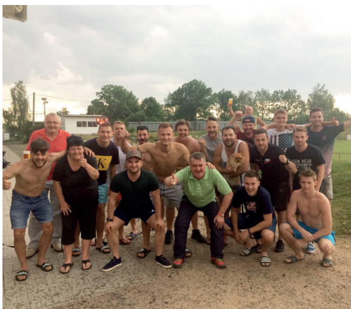
„Fotbalové Áčko slaví postup do krajského přeboru“

Začátek podzimní části soutěže se B mužstvu náramně povedl. Po čtyřech zápasech jsme měli plný bodový zisk se skóre 26:4. V dalším kole se jelo do Kojic, kde po otřesném prvním poločase (1:2) svítil na tabuli výsledek 2:2. Dalších osm zápasů skončilo plným tříbodovým ziskem, až v posledním kole jsme na domácím hřišti remizovali se Semínem opět 2:2. Stejně jako na podzim jsme první čtyři kola jarní části vyhráli. Následovala slabší pasáž, kde se ztratilo hodně bodů, až do zápasu o první místo v Selmicích, které skončilo 2:2. Oba celky se dělily o první místo. Do konce soutěže zbývaly čtyři zápasy a bylo jasné, že pokud se podaří vše vyhrát, skončíme na prvním místě. Poslední čtyři utkání byla bojovná, cíl se podařil a může se slavit postup do 3. třídy.