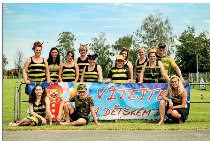
„Organizační tým dětského dne 9. 6. 2019.“