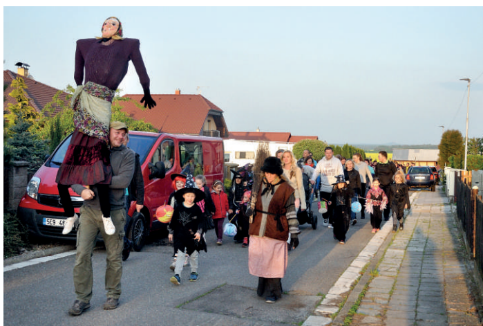
„Průvod čarodějů a čarodějnic.“