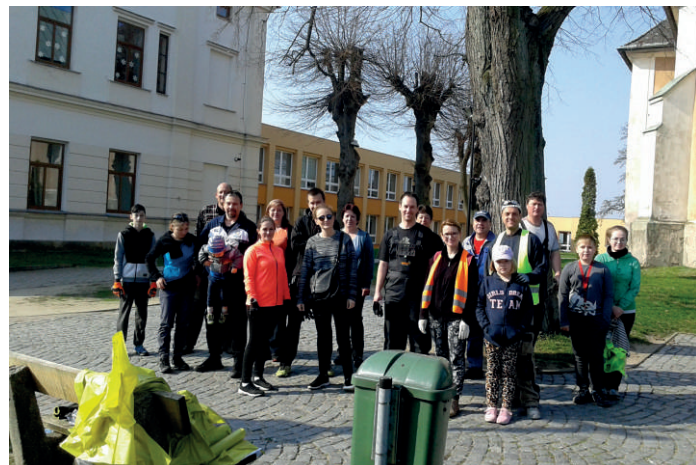
„Účastníci brigády Uklidme Česko.“