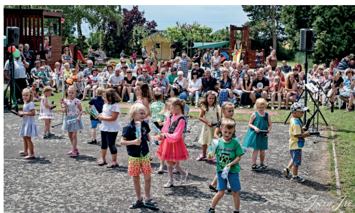
„Oslavy 40 let na zahradě MŠ.“