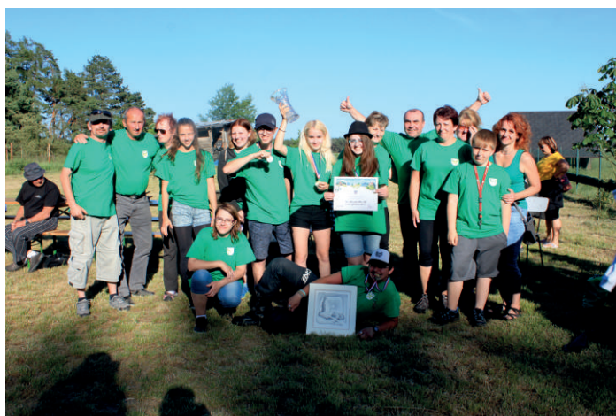
„Naše výprava v Bělé pod Bezdězem.“