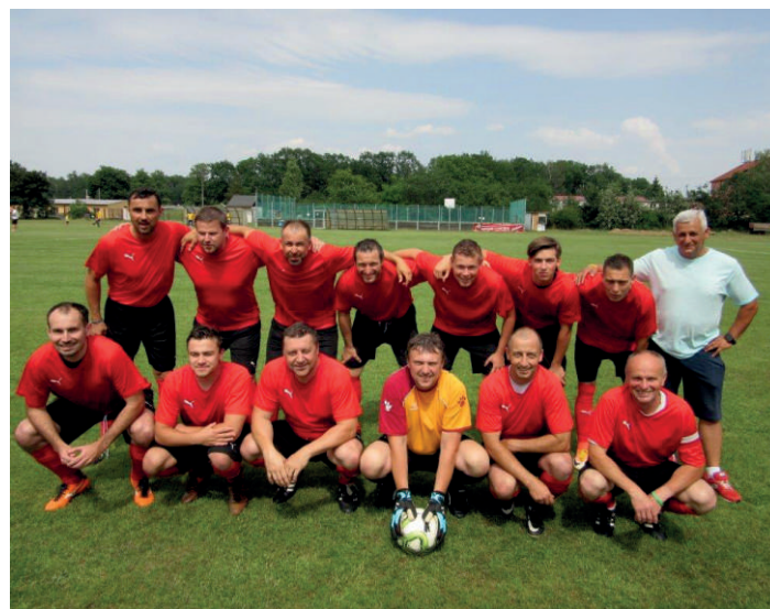
„Fotbalové Bé-čko slaví postup do 3. třídy“