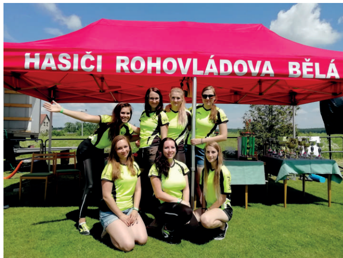
„Tým žen RB Crew“

Na 1. června byla naplánována tradiční soutěž o Pohár starosty obce pořádaná ve prospěch Parent Projectu. Letos se konal již 13. ročník této akce. Dopolední část byla poznamenána slabou účastí týmů z důvodu termínové kolize s dalšími závody, nicméně zúčastnění si soutěž užili.