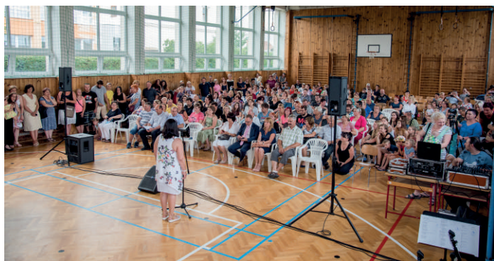
„Oslavy 140 let v tělocvičně ZŠ.“

Na závěr školního roku proběhly oslavy k výročí 140 let založení základní školy a 40 let od otevření mateřské školy. V pátek 21. června se slavilo v základní škole. Základem byla akademie žáků jednotlivých tříd, která proběhla dopoledne pro děti MŠ a odpoledne pro ostatní veřejnost. Děti během ní ukázaly své taneční, pěvecké i dramatické umění. Návštěvníci si prohlédli prostory školy a zhlédli doprovodný program, o který se postarala dětská rocková skupina Buď fit ze ZUŠ Přelouč a dechová hudba Vladimíra Kosiny.